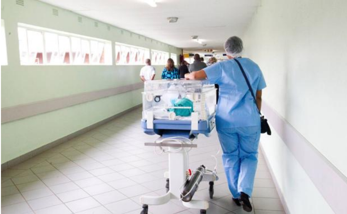
Personal sanitario en el pasillo de un centro.

Dos hospitales valencianos se encuentran entre la lista de los mejores centros de salud de España, un ranking que reúne tanto a hospitales públicos como privados de la geografía nacional.