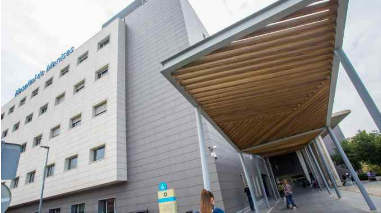
Neurología y Enfermedades Infecciosas del Hospital de Manises, entre los mejores servicios hospitalarios de España.